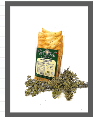
ORIGANO / OREGANO