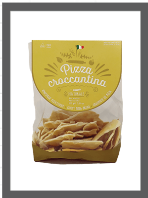
CLASSICA / CLASSIC