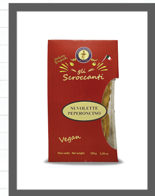
PEPERONCINO / CHILLI