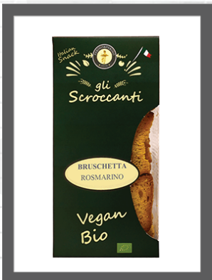
ROSMARINO / ROSEMARY