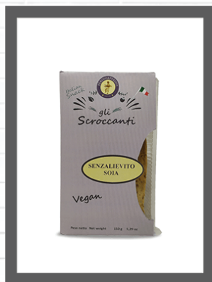
SOIA / SOY