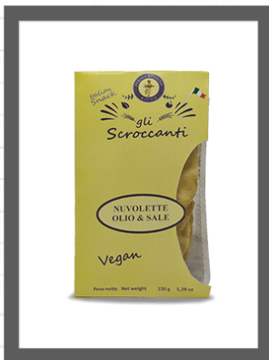
OLIO& SALE / OIL & SALT