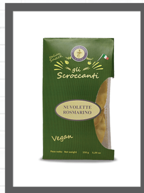
ROSMARINO / ROSEMARY