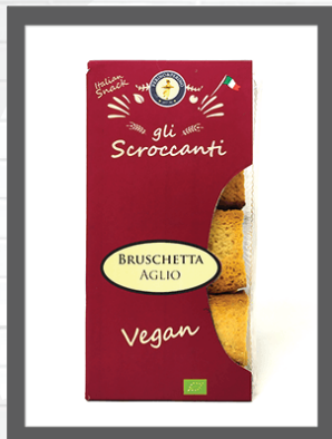
AGLIO / GARLIC