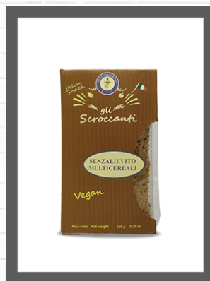
MULTICEREALI / MULTICEREAL